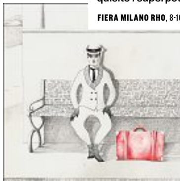
FIERA MILANO RHO, 8-10 MARZO. CARTOONICS.